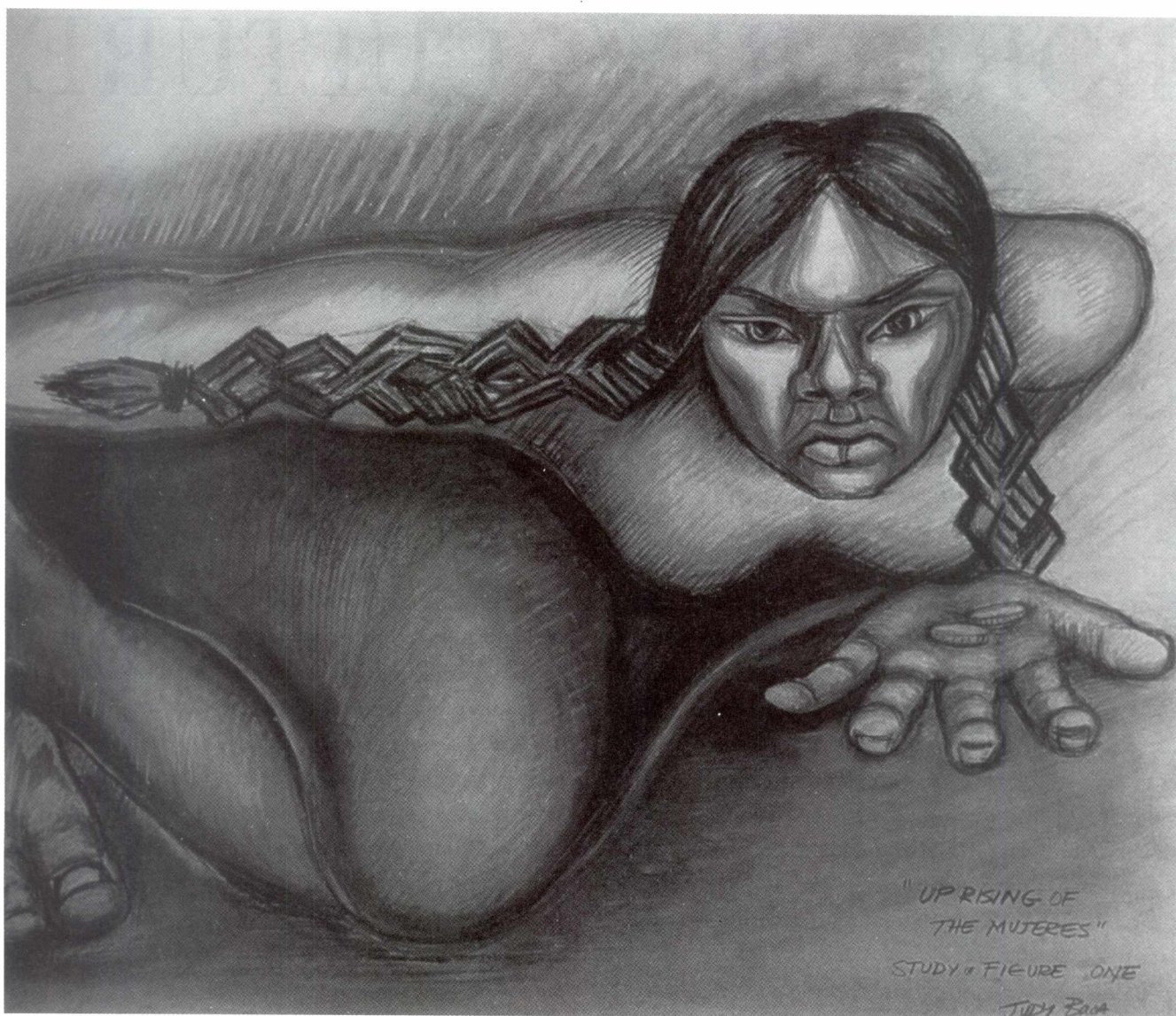
Judith Francisca Baca, Uprising of the Mujeres ©, 1979 (pastel on paper).

sistencia a las manifestaciones de la cultura estadounidense, todo ello visto, reitero, desde una perspectiva mexicana.