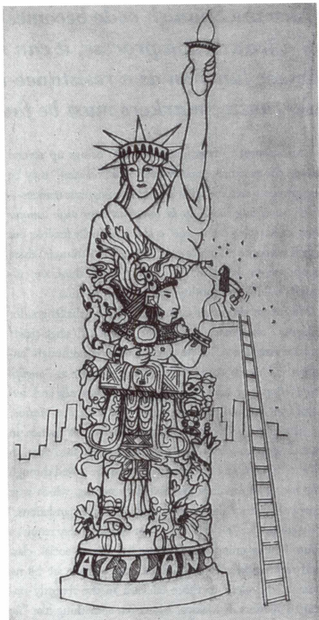
Ester Hernández, Libertad © 1976 (etching).

The translation referred to here is linguistic, of course, although it is also cultural. In order to illustrate this, I would like to propose an example of a text which can hardly be translated in any conventional way because the whole point is that it is addressed not only to a bilingual audience but to a very specifically bicultural Chicana /o audience. Entitled “La loca de la raza cósmica”, by La Chrisx, it appears in Tey Diana Rebolledo and Eliana S. Rivero’s Infinite Divisions. An Anthology of Chicana Literature and is a clear example of “talking back” not only to a male Chicano text like “Yo soy Joaquín” by “Corky” Gonzales, but also to Whitman’s literary tradition of me-as-male in a poem such as “Song of